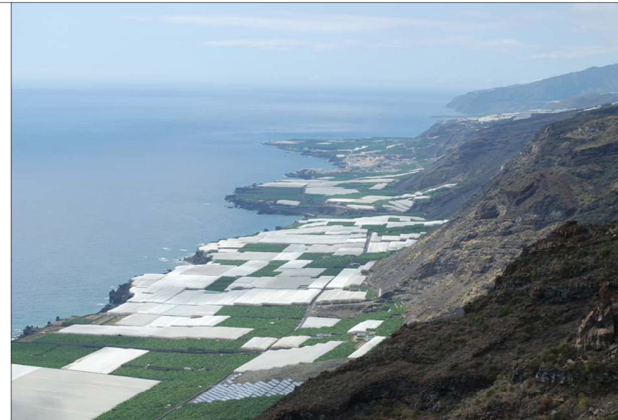
4- Panorámica de amplia perspectiva desde los confines del municipio en la zona de Santa Cecilia/Pinar de Sotomayor. Visual hacia el norte desde donde se domina toda la plataforma costera desde El Remo hasta la Bombilla/Las Hoyas.