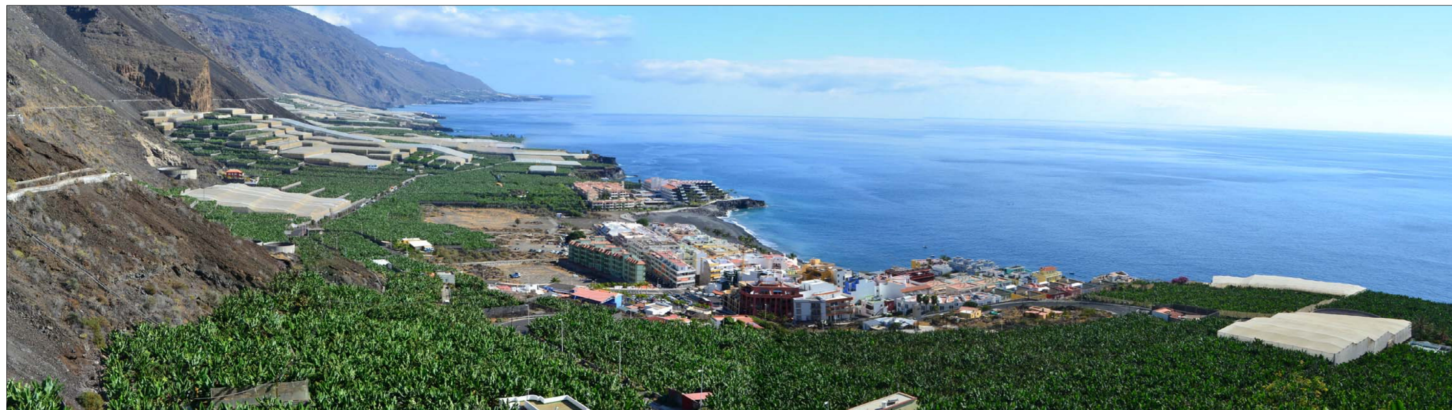
5- Visual norte-sur de la plataforma costera: núcleo de Puerto de Naos y el potente entorno agrario, con esta perspectiva del litoral oeste que se pierde hacia Fuencaliente.