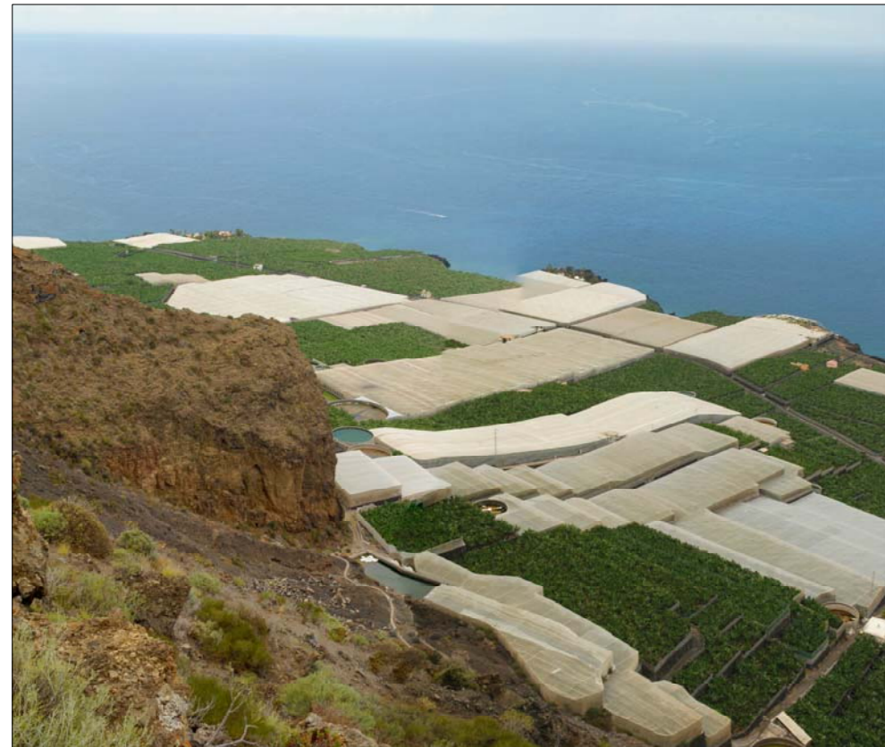
2- Desde el mismo lugar de corniza de acantilado se fuga hacia el sur el espacio de actuación, manto de plataneras en buena parte bajo protección de malla plástica. Vemos en primer plano el domo norte de toba hialoclastítica.