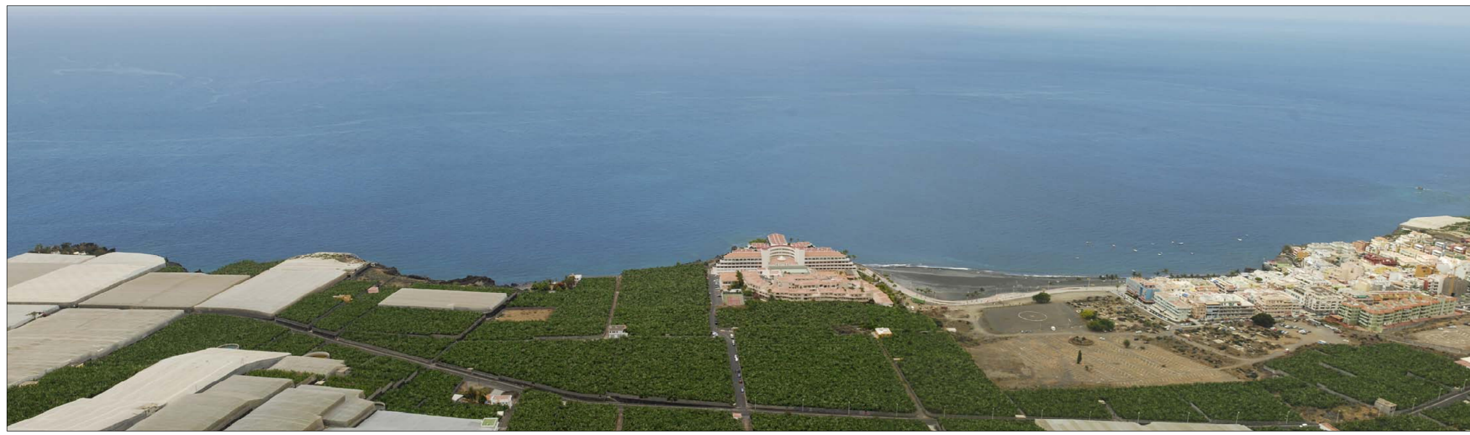
1- Desde el acantilado sobre la plataforma costera se tiene una visual amplia y comprensiva de todo ese espacio litoral, aunque son puntos panorámicos de difícil acceso. Vemos el núcleo urbano de Puerto de Naos y la extensión agraria hacia el sur, con LP-213 que define la zona de actuación.