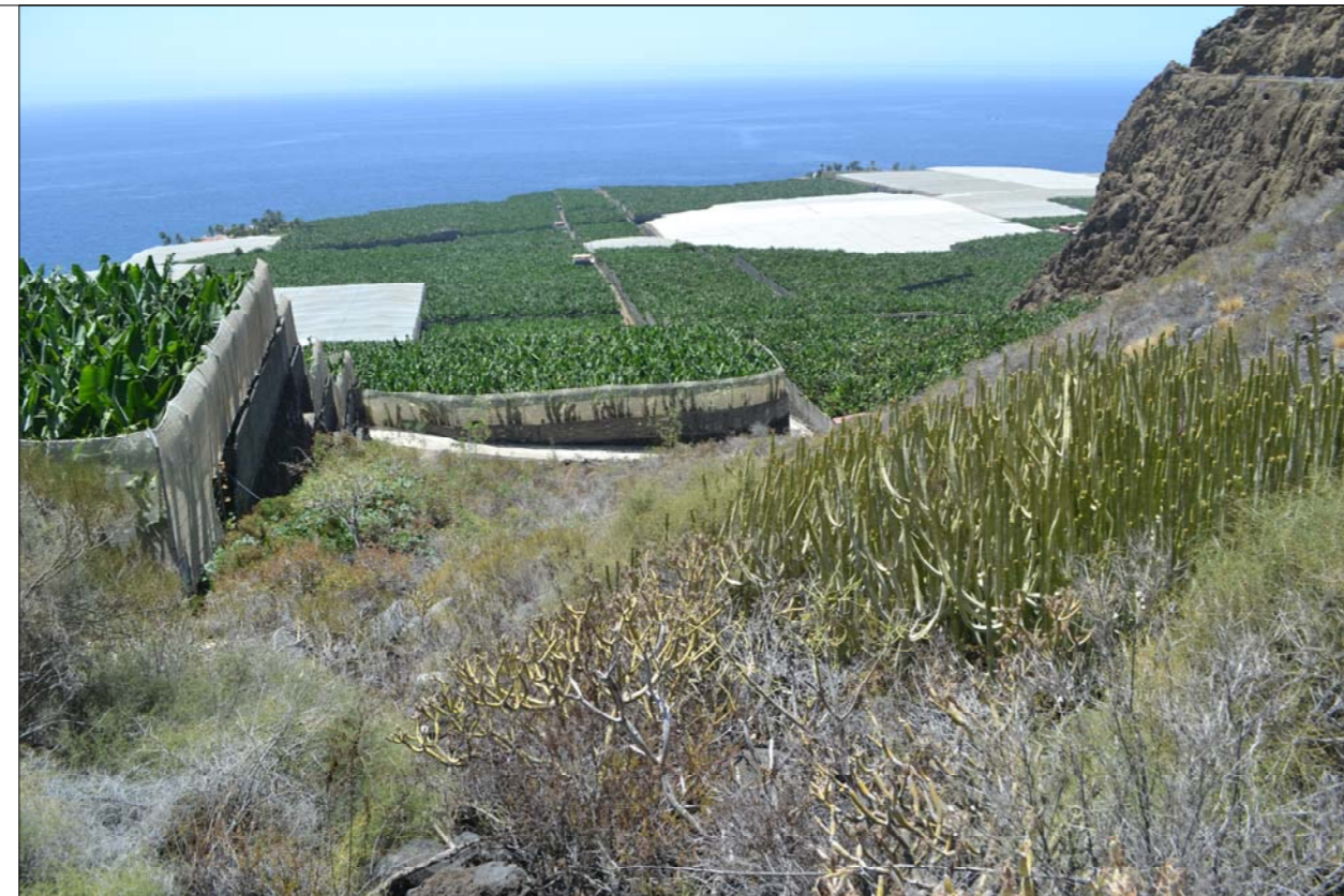
3- Desde las laderas de Charco Verde, lomos de "Parolínea aridanae", se tiene esta visual donde se aprecia calle de finca que define el límite sur de la actuación, y del ENP-P16. A la derecha está el roque sur de Toba hialoclastítica.