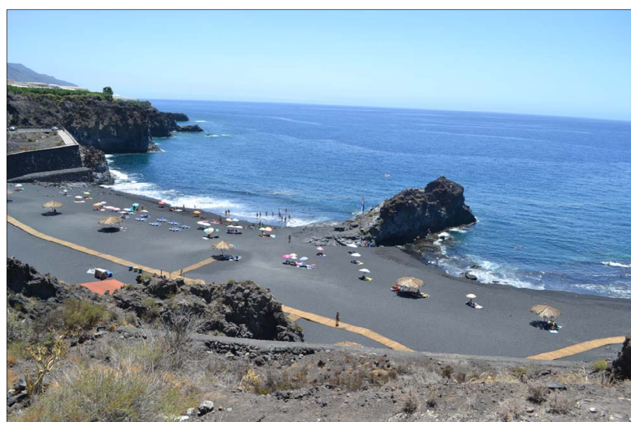
Equipamientos de playas dotadas con que cuenta el municipio: Charco Verde (izq-6) a unos 400 del límite sur de la actuación; y Puerto de Naos (dc-7), ocupando el frente de este núcleo y lindando con el sector norte de la actuación.